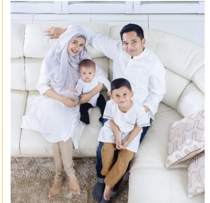
PT Asuransi Allianz Life Syariah Indonesia