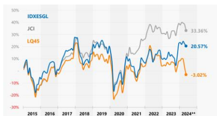
Grafik 1: Peforma Historis IDXESGL, JCI, dan LQ45 [1]